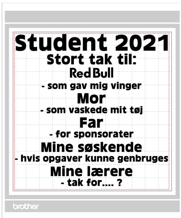
Student 2021 T-shrit